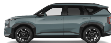
Iceberg Green [IEG] metallic