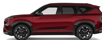
Magma Red [OVR] metallic