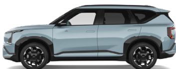
Frost Blue [EBB] solid