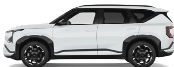
Snow White Pearl [SWP] metallic (pearleffekt)