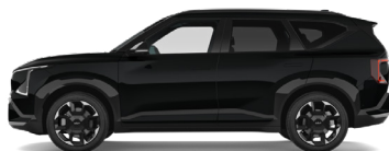
Fusion Black [FSB] metallic (pearleffekt)