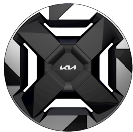
EV5 Plus 18" aluminiumfälgar 235/60 R 18