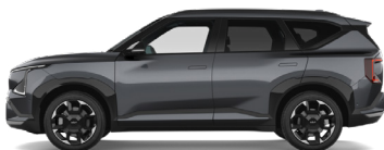
Gravity Gray [KDG] metallic