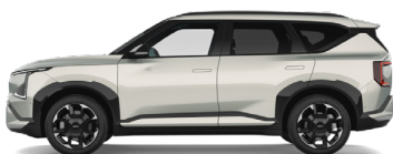
Ivory Silver [ISG] metallic