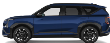
Dark Ocean Blue [BU3] metallic