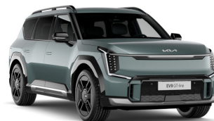
Iceberg Green [IEG] metallic