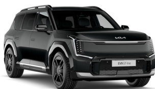
Aurora Black Pearl [ABP] metallic (pearleffekt)