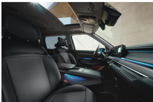
EV9 Veganläder Svart/Grå