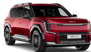
Flare Red [C7R] metallic