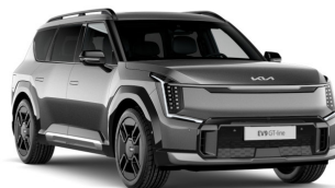
Pebble Gray [DFG] metallic