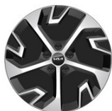
18" aluminiumfälg (Hybrid Action & Advance)