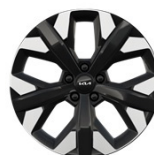
19" aluminiumfälg (Plug-in Hybrid Action & Advance)